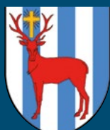
Commune de Provence

Déjà bientôt plus d'une dizaine d'années que la Municipalité et la population de Provence attendent de voir le bout de la pale d'une première éolienne... Le projet est complexe et avance sûrement, mais bien trop doucement à notre goût. Et même si la mise à l'enquête publique se profile dans un avenir proche, nous sommes bien conscients qu'avant que le chantier ne démarre réellement, la Municipalité aura encore à traiter des montagnes de papiers et devra répondre à de multiples questions.